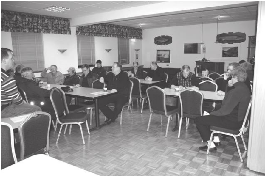
Frá opnu húsi