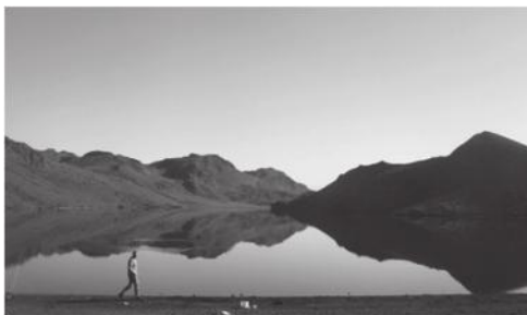
- Við Djúpavatn í blíðskapar veðri.

Veiðitímabil er frá 15. maí til 25. september. Á hverju sumri er sleppt talsverðu af vænum fiski í vatnið, svo verður einnig núna.