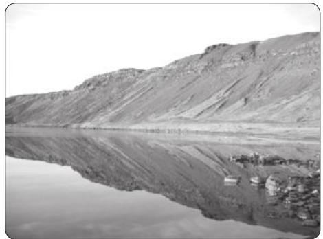
Mynd frá Hlíðarvatni núna 25.11. sl.