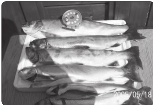
Fagar bleikjur úr Hlíðarvatni, veiddar þann 18. maí